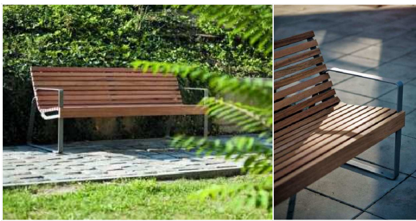
LAVIČKA: OCELOVÁ KONSTRUKCE, DŘEVĚNÝ LAŤOVÝ SEDÁK I OPĚRADLO