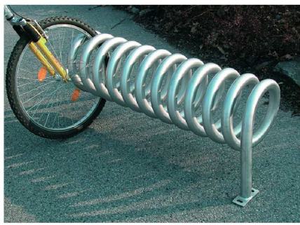
STOJAN NA JÍZDNÍ KOLA