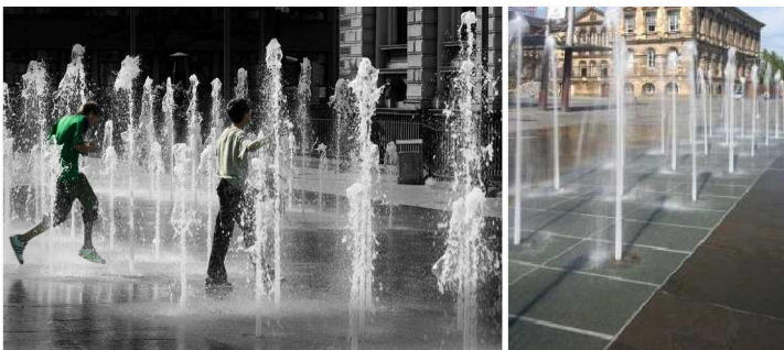
ŘADA FONTÁN: PŘÍKLADY OBDOBNÉHO REALIZOVANÉHO ŘEŠENÍ, CÍLEM JE UMOŽNIT VĚTŠÍ KONTAKT S VODOU, NEJDYNAMIČTĚJŠÍM PRVKEM KRAJINNÉ ARCHITEKTURY