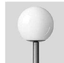
SVÍTIDLO VEŘEJNÉHO OSVĚTLENÍ: OPÁLKOVÁ KOULE NA 5m STOŽÁRU