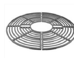
OCHRANNÁ MŘÍŽ KE STROMŮM NA ZPEVNĚNÝCH PLOCHÁCH